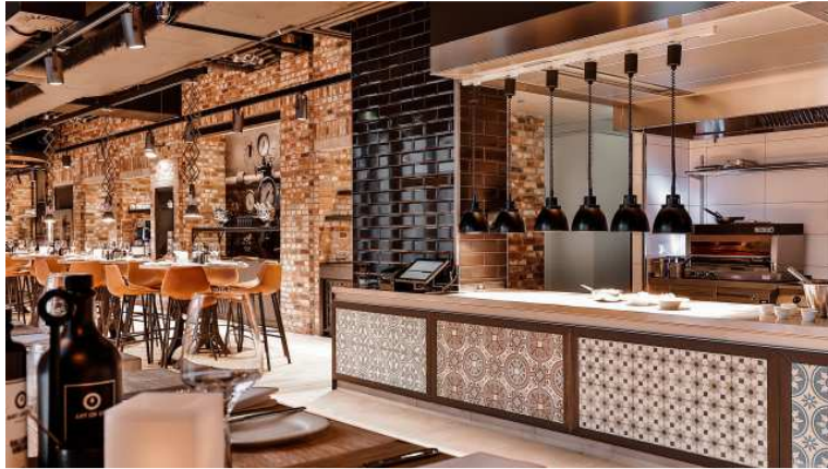
Bildunterschrift: Blick ins Restaurant DURON Bar & Grill mit Front Cooking Küche.