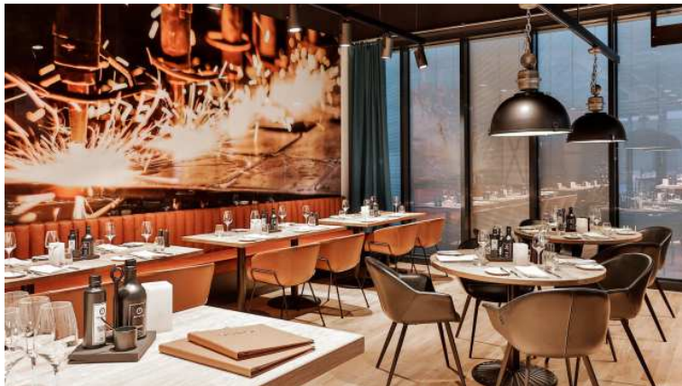
Bildunterschrift: Die hohen Fenster halten das Restaurant DURON Bar & Grill offen und hell.