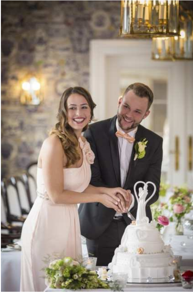
Bildunterschrift: Die Aussteller präsentieren Mode, Torten und Dekoration für jeden Geschmack.