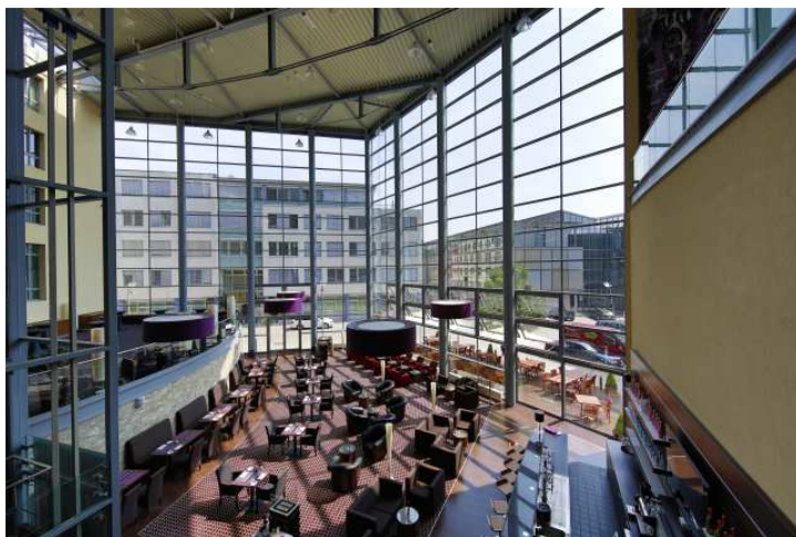
Bildunterschrift: Die Lobbybar im Dorint Hotel am Dom Erfurt.