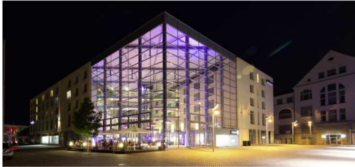
Bildunterschrift: Eleganz und Moderne ergeben im Dorint Hotel am Dom Erfurt ein stimmiges Bild.